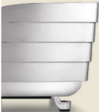
T 3 STEELUX