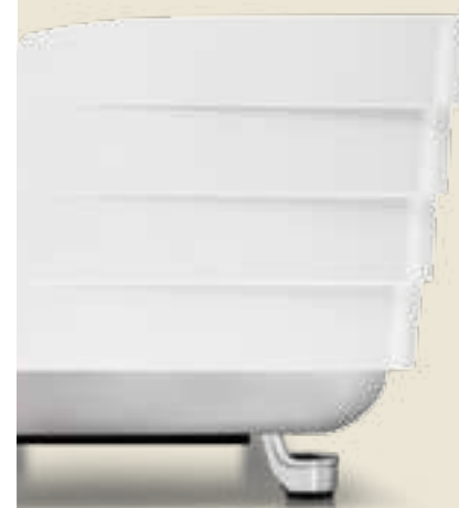
T 3 WHITE + STAINLESS STEEL BASE