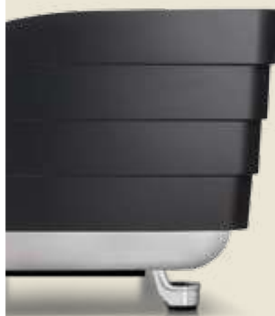
T 3 BLACK + STAINLESS STEEL BASE